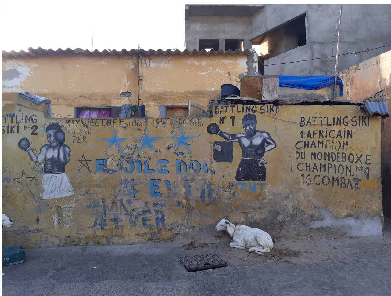
La maison où est né Battling Siki à Saint-Louis du Sénégal

Site officiel du Théâtre K. : theatrekcompagnie.com