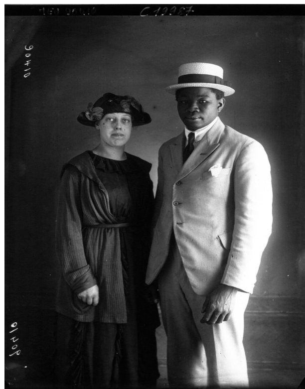
Battling Siki et son épouse.